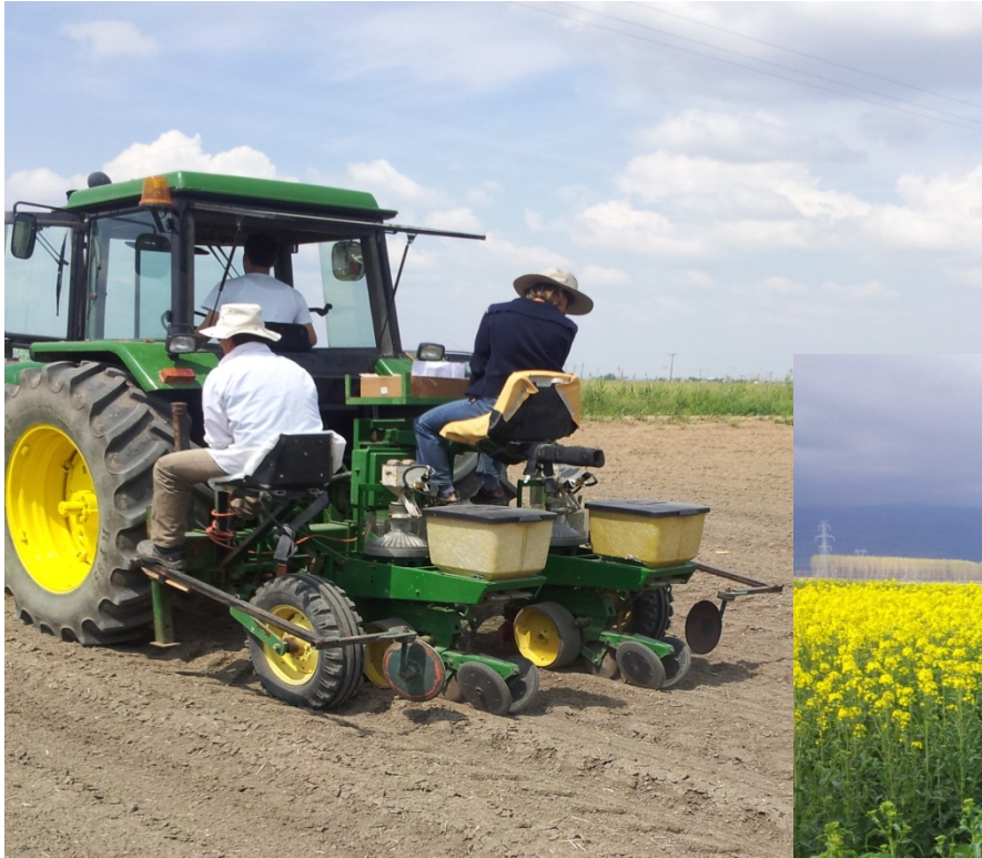
Σπορά αγρού διατήρησης