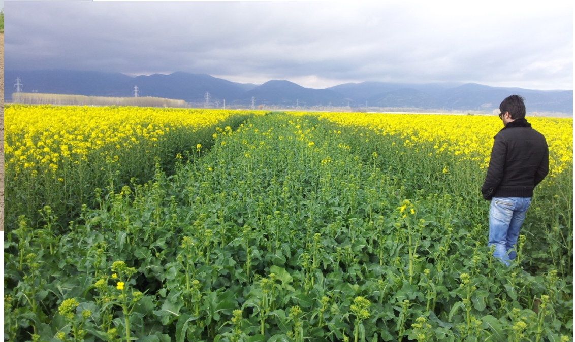
Αγρός σποροπαραγωγής ελαιοκράμβης