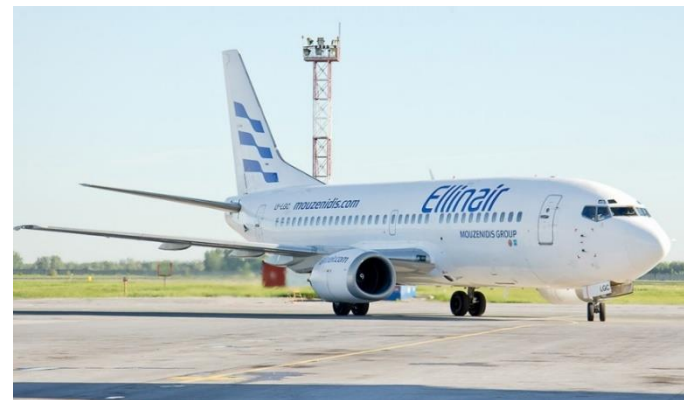
BOEING 737 /300