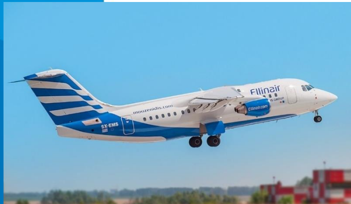
AVRO RJ 85

180 θέσεων – ενταγμένα στο στόλο κατά τους καλοκαιρινούς μήνες –ACMI